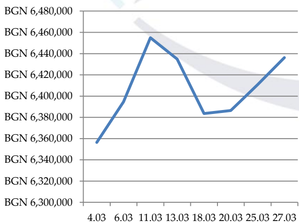
НСА за месец Март