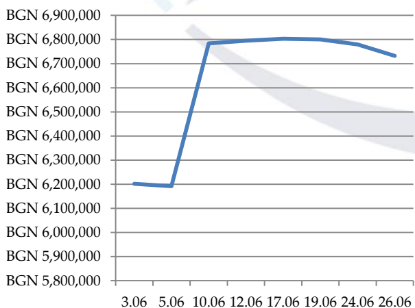
НСА за месец Юни