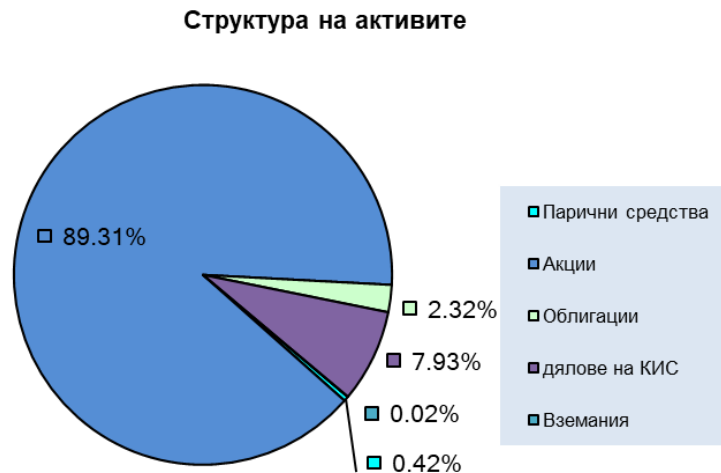
Фиг.1 Структура на активите

Инвестициите в ценни книжа на Фонда са съобразени с инвестиционните ограничения съгласно Проспекта и ЗДКИСДПКИ. Във връзка с целите, обвързани с високорисковия профил на Фонда, са селектирани такива финансови инструменти от сектори на пазара за ценни книжа, които се смятат за сравнително по-рискови и съответно по-високодоходни. Подбрани са отрасли в зависимост от тяхното състояние и компаниите в него.