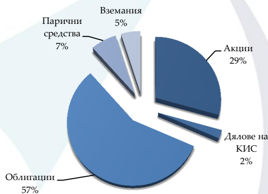
Структура на портфейл за месец Декември