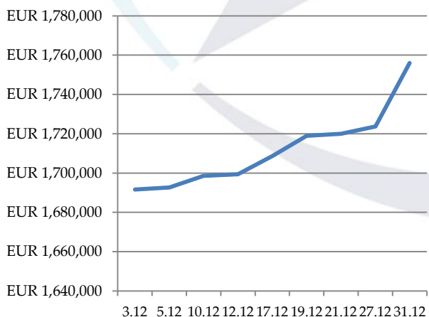
НСА за месец Декември