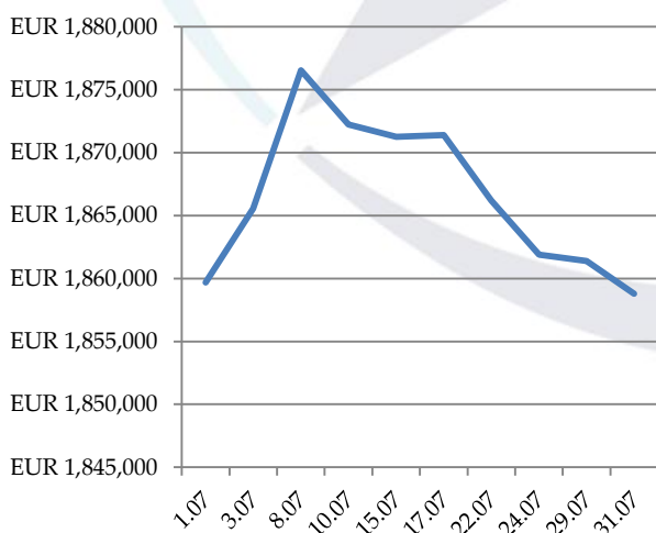
НСА за месец Юли