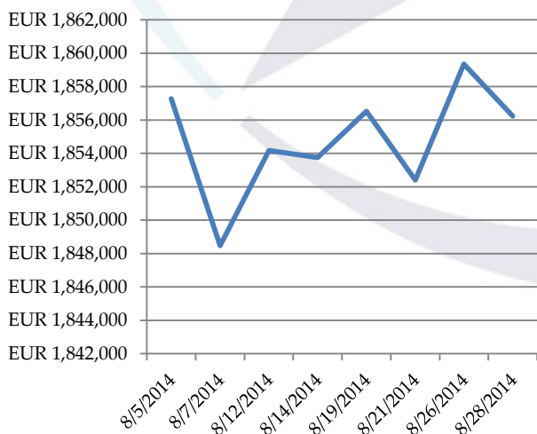
НСА за месец Август